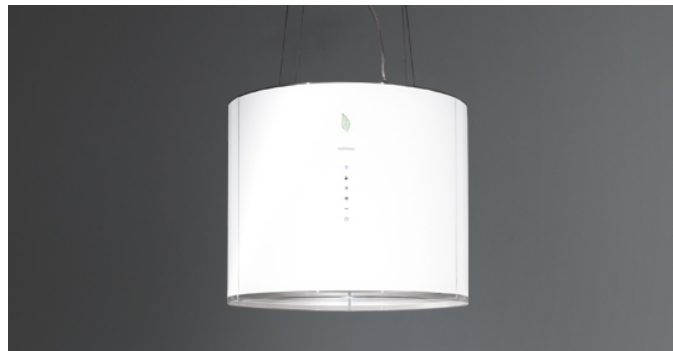
Poglądowe zdjęcie produktu Zdjęcie może dokładnie nie odpowiadać wybranej wersji